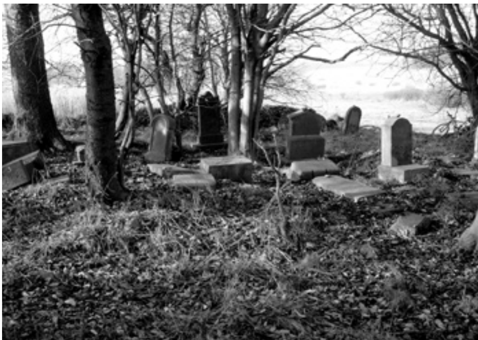
Poutnovský hřbitov na podzim 2005.