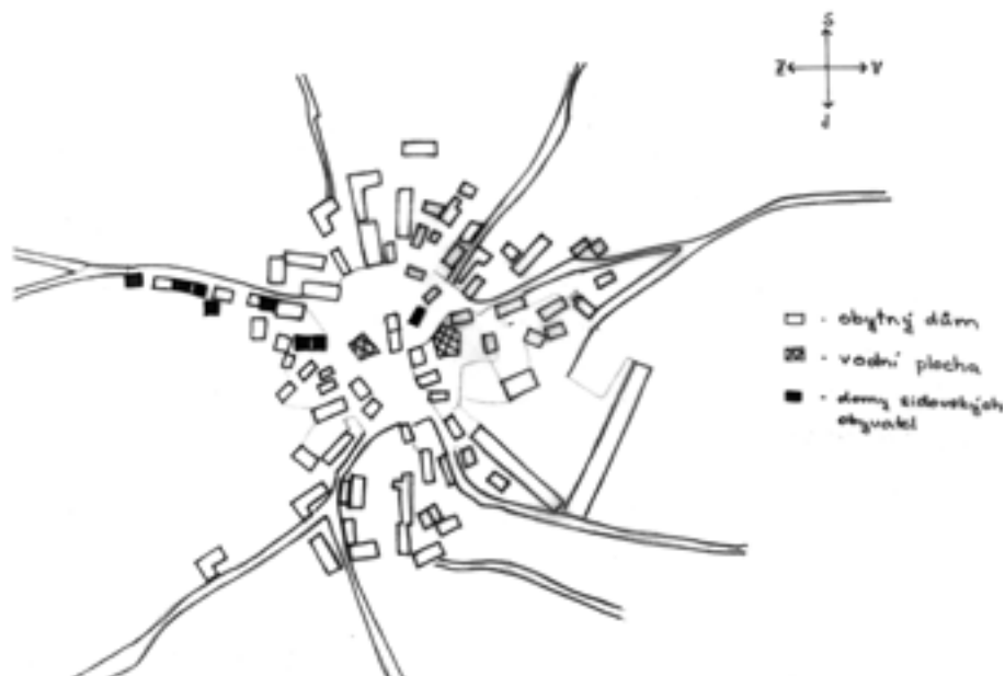
Mapka Poutnova v první polovině 19. století.

rozprostírají pole a pastviny. Samotný hřbitov je umístěn ve větší remízce, ve které dominuje několik větších smrků. Hřbitov má čtvercový tvar o rozměrech 18x18 metrů a s výměrou 324 metrů čtverečních je považován za jednu z nejmenších židovských nekropolí v Čechách a na Moravě. 29 Kolem hřbitova je postavena zeď z lomového kamene, která je na několika místech pobožena. Šířka zdi činí kolem padesáti centimetrů, a na jižní straně je zachována až do výšky sedmdesáti centimetrů. Bývalý vchod na hřbitov byl umístěn uprostřed východní zdi. Dlouhou dobu se hřbitov nacházel ve zpustlém stavu a většina náhrobků byla povalena. V květnu a v září 2007 skupina německých dobrovolníků z Aktion Sühnezeichen pod vedením Dr. Dietricha Erdmanna hřbitov vyčistila od spadáných větví a uschlých náletových dřevin. Všechny náhrobní kameny byly vyzdvíženy a některé z nich opraveny maltovým pojivem.