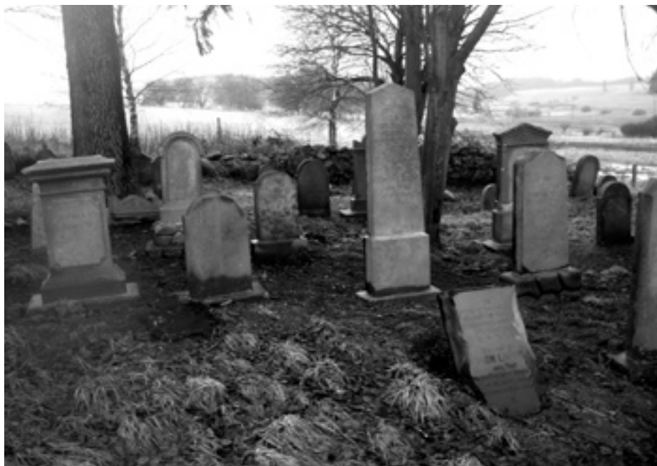
Poutnovský hřbitov 19. 1. 2008.

se záznamy z let 1840 až 1931. 30 Zde bylo možné nalézt den a místo úmrtí zesnulého, dále jméno osoby, která tělo ohledala, den pohřbu, místo trvalého pobytu, věk a rodinný stav, příčinu úmrtí a někdy i jméno rodinného příslušníka, a to především otce nebo manžela. Takto nabyté informace o osobě uvedené na náhrobku byly dále porovnávány s údaji uvedenými v židovských matrikách narozených a oddaných pro Poutnov. 31 Porovnány byly i se Soupisem židovských obyvatel v Čechách z roku 1793 a s Bau – Parzellen Protocoll der Gemeinde Pauten. 32 Pomocí těchto dokumentů se podařilo u některých osob pochovaných na hřbitově v Poutnově zjistit jejich rodinné a majetkové vztahy. Na základě informací z matrik se dokázaly i přímé vazby židovských obyvatel z Poutnova s ostatními židovskými komunitami v dnešním Karlovarském a Plzeňském kraji, i v ostatních krajích v Čechách. Jednalo se především o obce Arnoltov, Bečov nad Teplou, Drmoul, Chodová Planá, Horní Kozolupy, Karlovy Vary, Kořen, Labuť u Tachova, Luka, Mnichov u Mariánských Lázní, Planá, Polná u Havlíčkova Brodu, Stráže u Tachova a dalších.