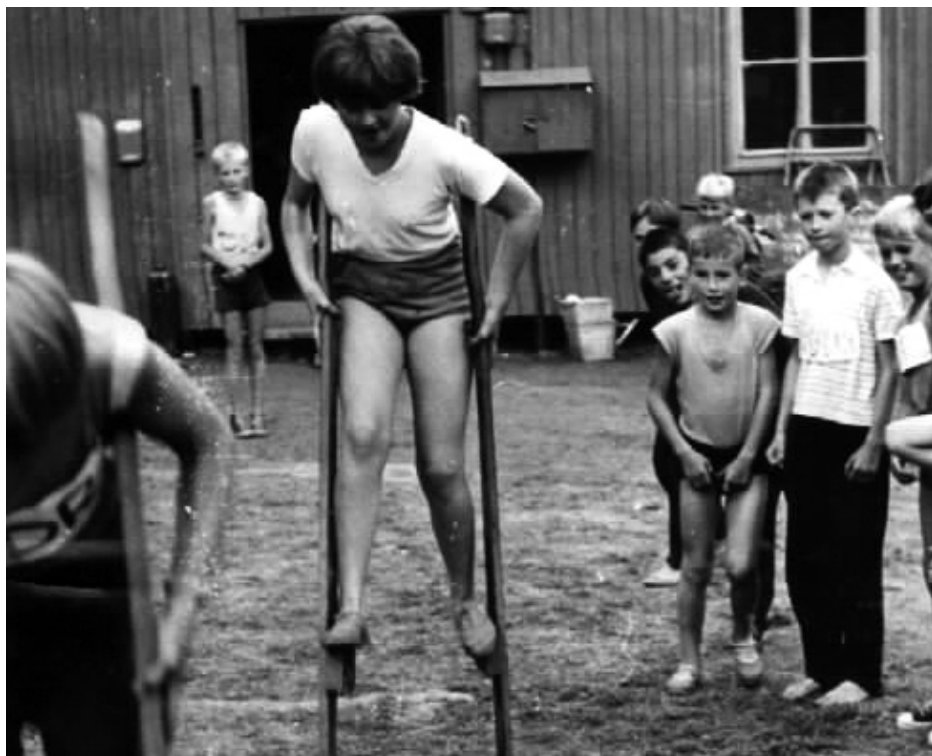
Svojšíň – tábor Radar 1964. Archiv SU Sokolov.

poněkud problematické. Okresní hygienik po prohlídce domu prohlásil, že tento tábor je nejlepší, co dosud viděl. 9 Vedení podniku se potom podařilo nalézt vhodné místo pro letní táboření a v roce 1961 zřídilo ve větší vzdálenosti pionýrský tábor 12. dubna na řece Želivce u Kožlí u Ledče nad Sázavou, kde postavilo objekt s 65 stany, v nichž roku 1961 pobývalo přes 430 a o rok později 297 dětí. Dne 8. 7. 1963 odešel večer oddíl na vycházku a při přechodu mostu spadl 11letý chlapec Jiří Helebrand do řeky. Neuměl plavat a začal se topit. Do vody za ním ihned skočila čtrnáctiletá Věra Švarcová a podařilo se jí ho vytáhnout. Jinak by asi tato příhoda skončila tragicky. 10