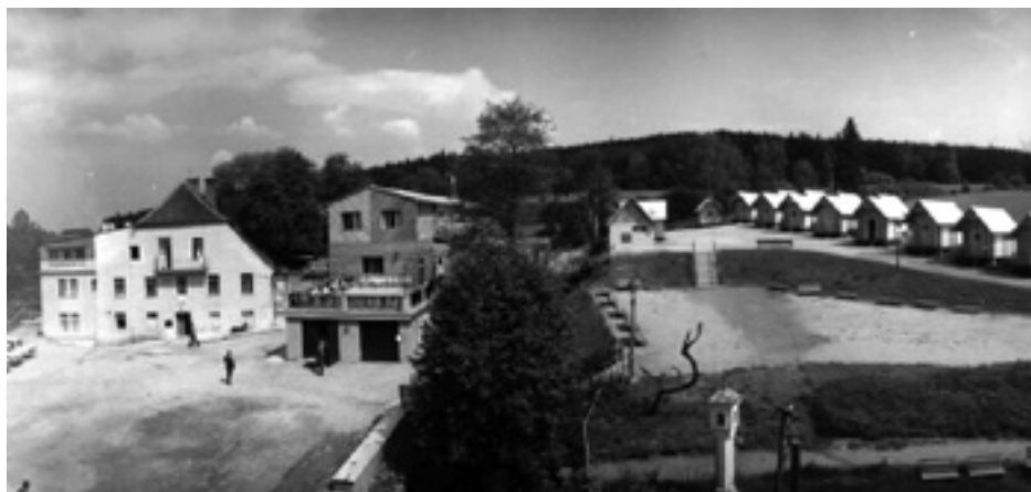
Tábor Sedlice 1974.