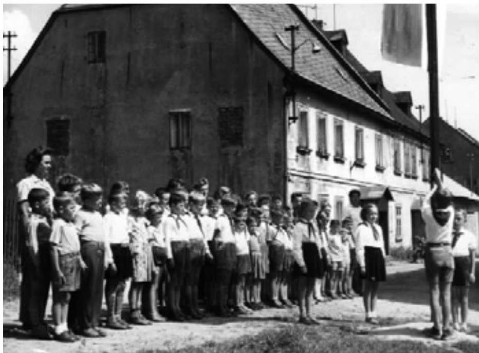
Tábor Boží Dar 1959. Archiv SU Sokolov.

podnik v roce 1960 objekt převedl k využití jiné organizaci (Pramen Plzeň). 6 V témže roce zakoupil tehdejší národní podnik Velkodůl Přátelství v Tisové rekreační chatu v Zelené Lhotě u Hojsovy Stráže na Šumavě. Zrekonstruoval ji a vybudoval u ní koupaliště. V budově s kuchyní a jídelnou pobývalo pak na letním táboře kolem 30 malých a ve stanech na 100 větších dětí. Kvůli velké vzdálenosti od Sokolova předal následně podnik chatu v roce 1966 Lachemě Kaznějov. Později, v roce 1974, se podařilo Dolu Přátelství v Březové získat hájovnu č. p. 214 s velkou zahradou ve Vícově u Přeštic, kde bylo možné umístit 60 stanů pro 120 dětí. 7